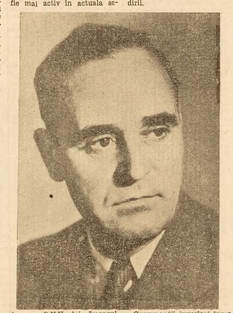
Guvernantul iugoslav înseală în mod demagogic și nerușinat poporul afirmând că ei ar construi socialismul...