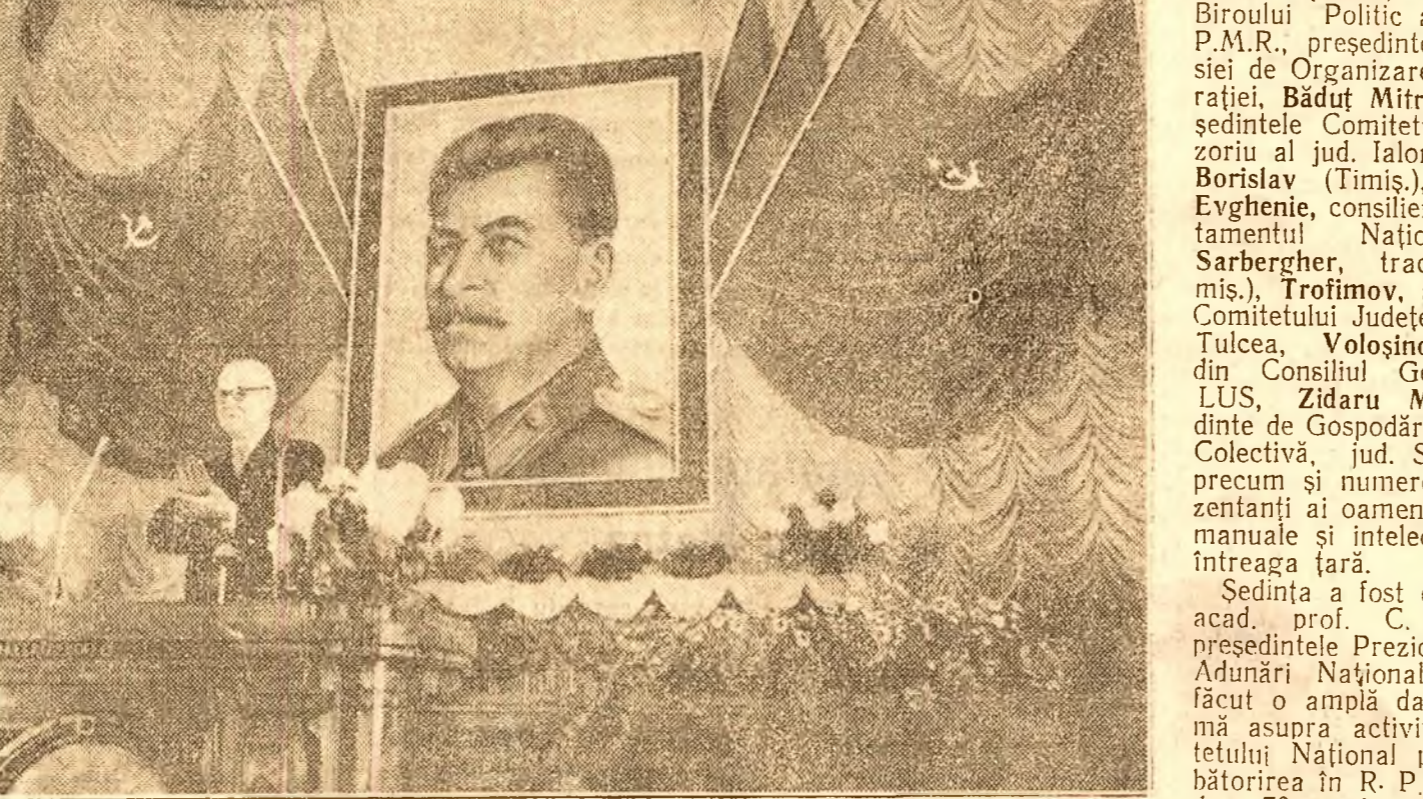
Acad. prof. C. I. Parhon, președintele Prezidiului Marii Adunări Naționale, aplaudând la ovațiile entuziaste ale asistenței pentru genialul învățător și conducător al omenirii muncitorești, tovarășul I. V. Stalin.