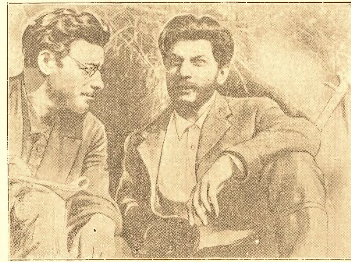
Pe ecranul Capitalei rulează marele film sovietic „Tovarășul Sverdlov”. Iată o scenă din film. Deporțat de guvernul țarist, Coba (numele conspirativ al tovarășului Stalin) și Sverdlov îl servu lui Lenin. Omul trebuie să aibă o inimă de oțel și atunci, plătosa de Sverdlov. Sunt cuvinte dintr-un discurs al lui Lenin. Ele exprimă întreg subiectul acestui film închinat unuia din luptătorii cu inima de oțel, neînfricat în luptă, fruntas al P.C. (b) al U.R.S.S., discipol credincios al lui Lenin. Odată cu viața lui Iacov Mihailovici Sverdlov, filmul ne înfățișează episcopul din lupta purtată de bolșevici în ilegalitate, apoi ne poartă în zilele Marii Revoluții Socialiste din Octombrie și în primii ani ai Puterii Sovietice. Este un film deosebit de interesant, impresionant și bogat în învățăminte pentru fiecare om muncitor.