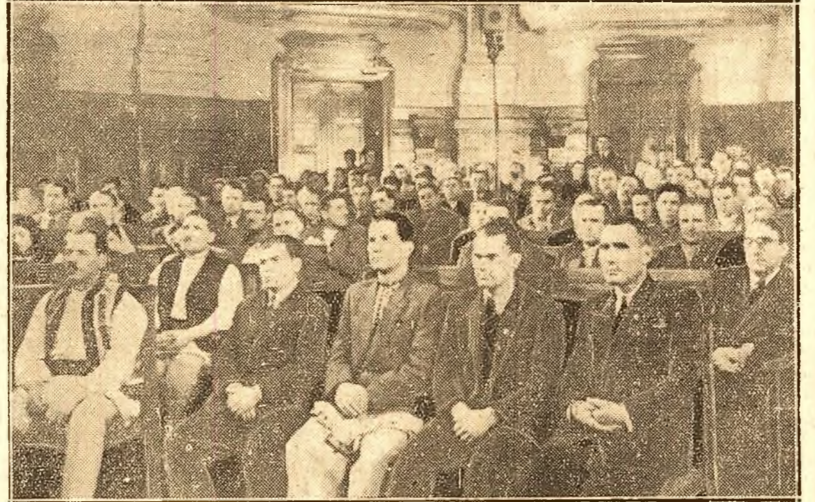
Un aspect al incintei Marii Adunări Naționale în timpul expunerii tovarășului Vasile Luca

Marea Adunare Națională a omagiat memoria lui Vasil Kolarov Depunerea Proiectului de lege pentru stabilirea bugetului general al R.P.R.