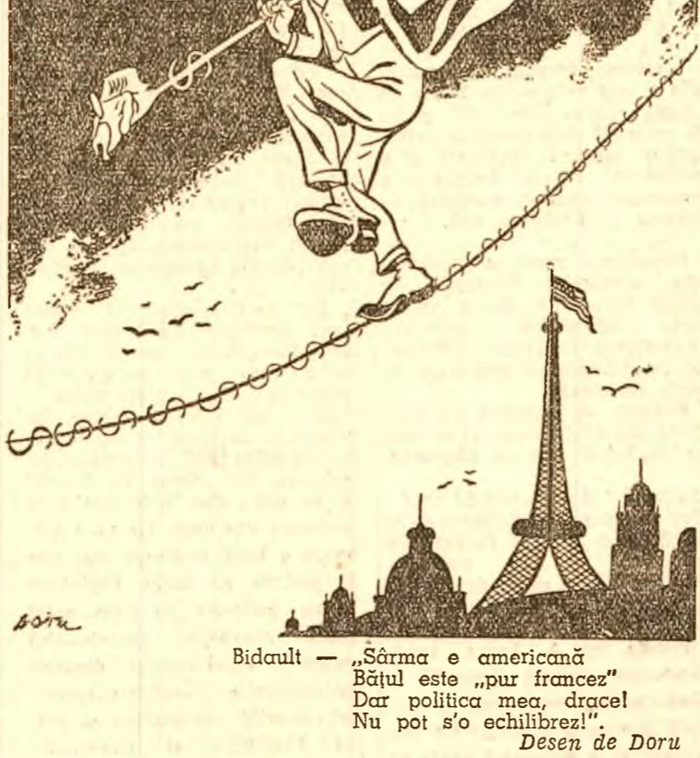
Bidault — „Sărma e americană Bețul este „pur francez”. Dar politica mea, drace! Nu pot s'o ochilibrez!” Desen de Doru

1950, a președintelui guvernului Republicii Democratice Vietnameză, Ho Chi Minh, propunând tuturor guvernelor să stabilească relații diplomatice cu Republica Democrată Vietnameză. Guvernul Republicii Populare Bulgarie, examinând această declarație, a hotărât să recunoască guvernul Republicii Democratice Vietnameză și să stabilească cu el relații diplomatice.