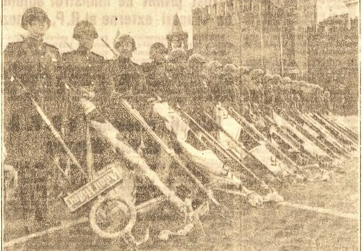
Iată steagurile diviziilor hitleriste care au semănat groaza în rândurile tuturor armatelor capitaliste zăcând la picioarele glorioșilor ostași sovietici, salvatorii omenirii de ciurma hitleristă. Acesta este un avertisment la care trebuie să ia aminte toți cei ce ar cuteza să pornească pe urmele „invincibilei” armate a imperialismului german.