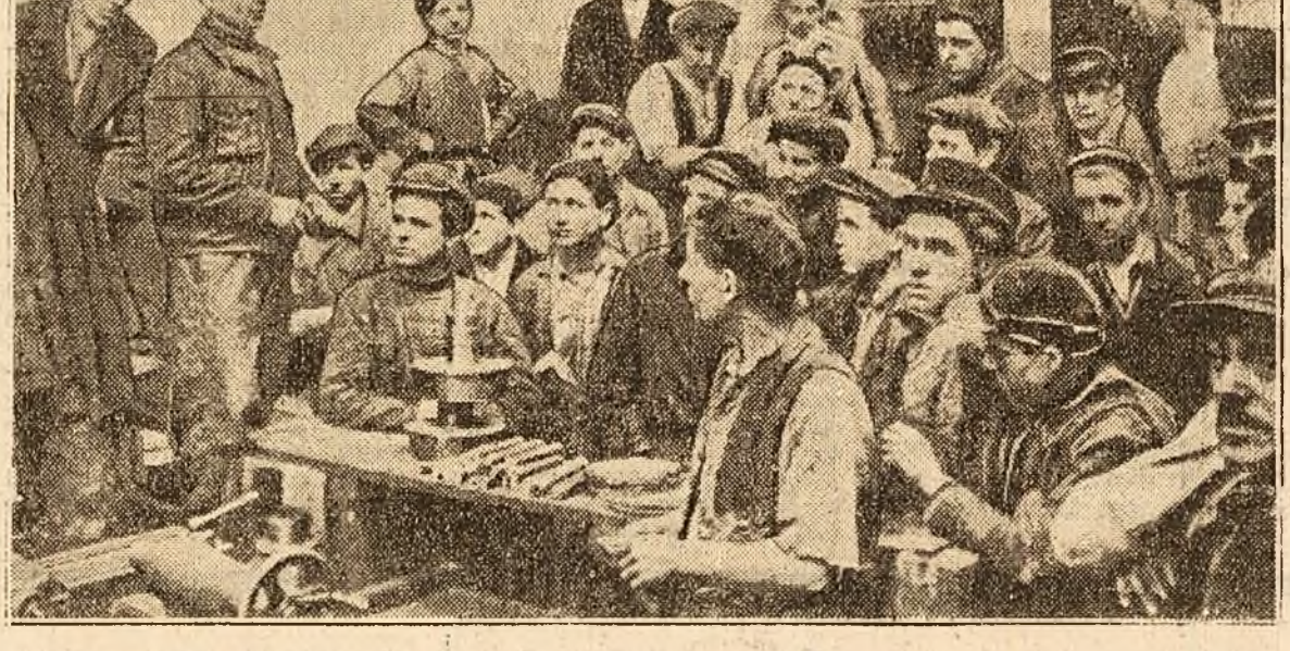
Participați cu toții la alegerea comitetului de luptă pentru pace din Uzina noastră.

În județul Roman sărbătoresc. Cu acest prilej, muncitorii, țărânii muncitori și intelectuali și-au arătat voința lor dărză de a lupta pentru întărirea Republicii noastre Populare, pentru întărirea forțelor păcii, conduse de Uniunea Sovietică, împotriva ațățătorilor la un război, imperialiștii americani și englezi și a slugilor lor de teapa bandiților hitleriști.