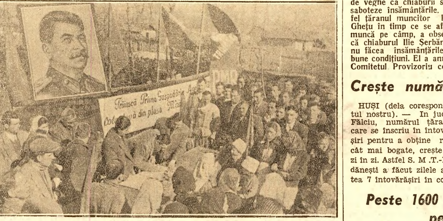
39 familii de țărani săraci și mijlocași din comuna Baba Ana, județul Buzău, au pășit la o viață nouă eliberată de exploatarea chiaburescă, constituind o gospodărie agricolă colectivă.

Duminică 26 și luni 27 Februarie în numeroase județe din țară s'au constituit în cadrul unor adunări însușite 47 din aceste noi gospodării agricole colective.