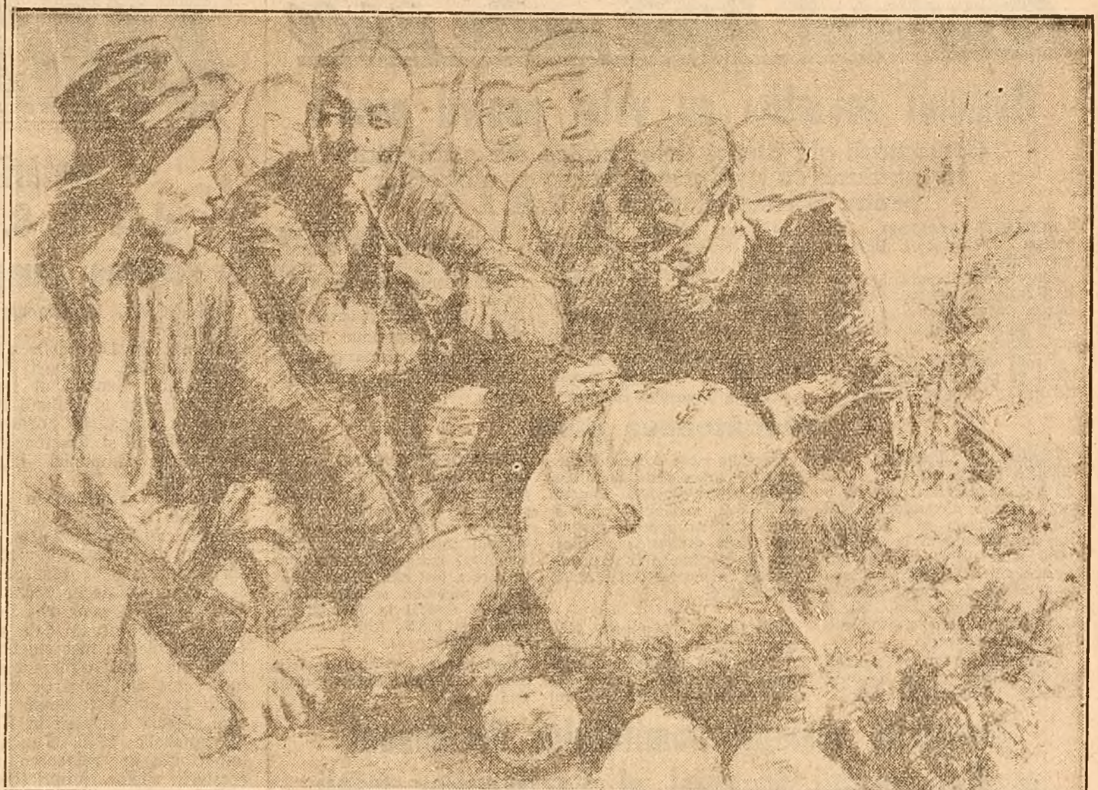
Țărani chinezi pregătesc daruri pentru I. V. Stalin