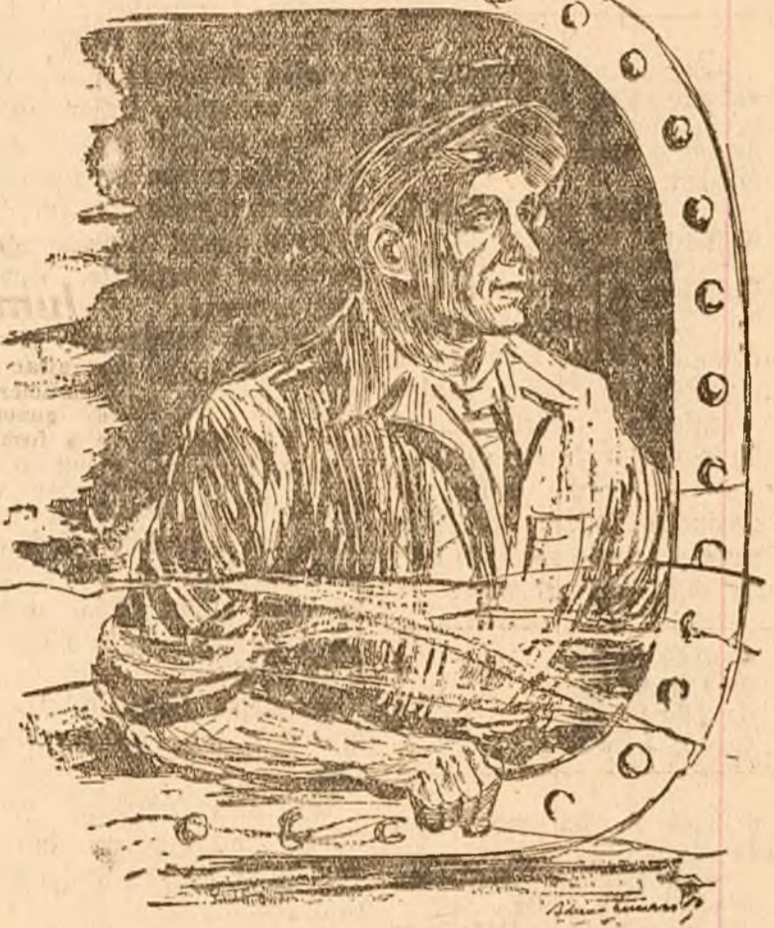
Desen de ADRIAN LUCACI