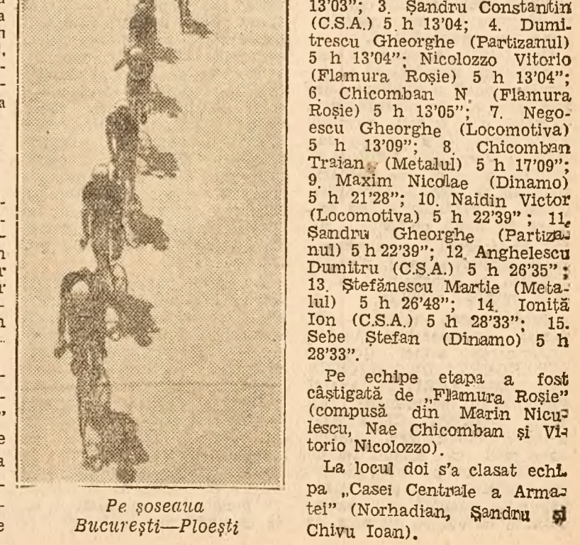
Pe șoseaua București-Ploiești