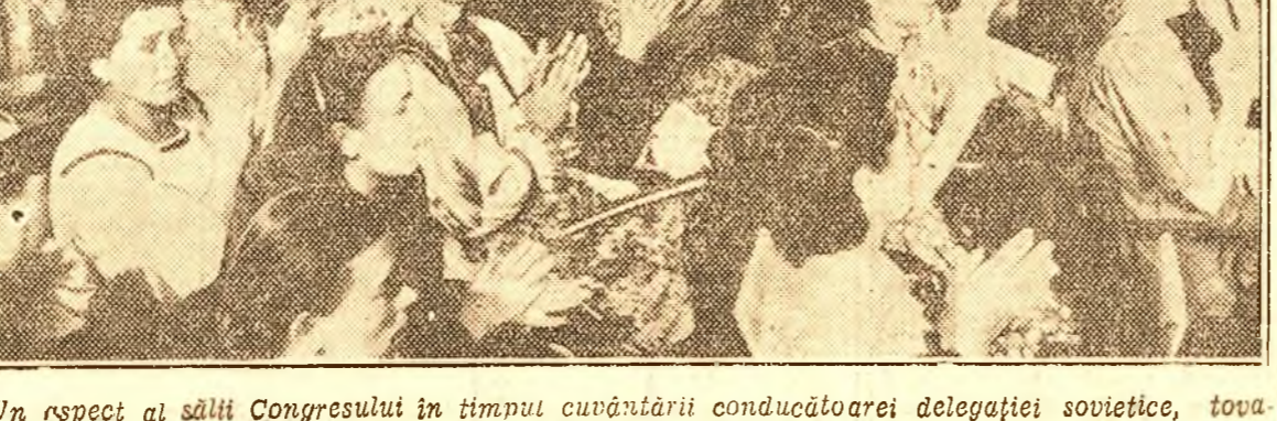
Un respect al sălții Congresului în timpul cuvântării conducătoarei delegației sovietice, tovarășa Maria Kazanțeva.

„Eu sunt fiica unui muncitor simplu. Am făcut studii superioare; am câștigat titlul de doctor în medicină; am fost numită în postul de răspundere, ca de pildă acela de redactor la Gazeta Medicală din întreaga Uniune Sovietică” — a spus vorbitoarea.