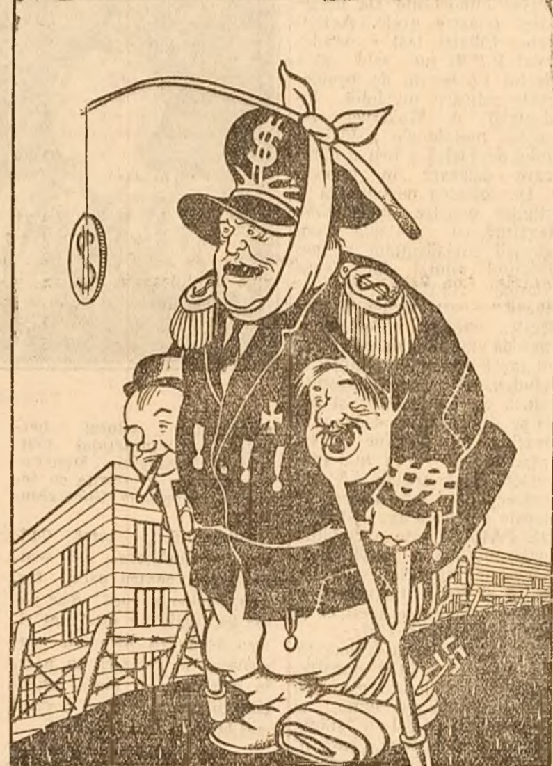
desen de Doru