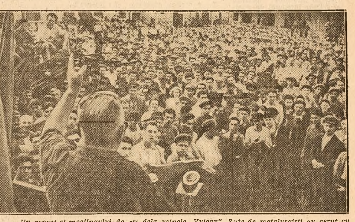
Un aspect al meetingului de ieri dela uzinele „Vulcan”. Sute de metalurgiști au cerut cu tărie încetarea mărgavei agresiunii a imperialiștilor americani împotriva poporului coreean.

Să ne arătăm dragostea frățască față de muncitorii și țărânii coreeni ce luptă pentru libertatea Patriei lor!