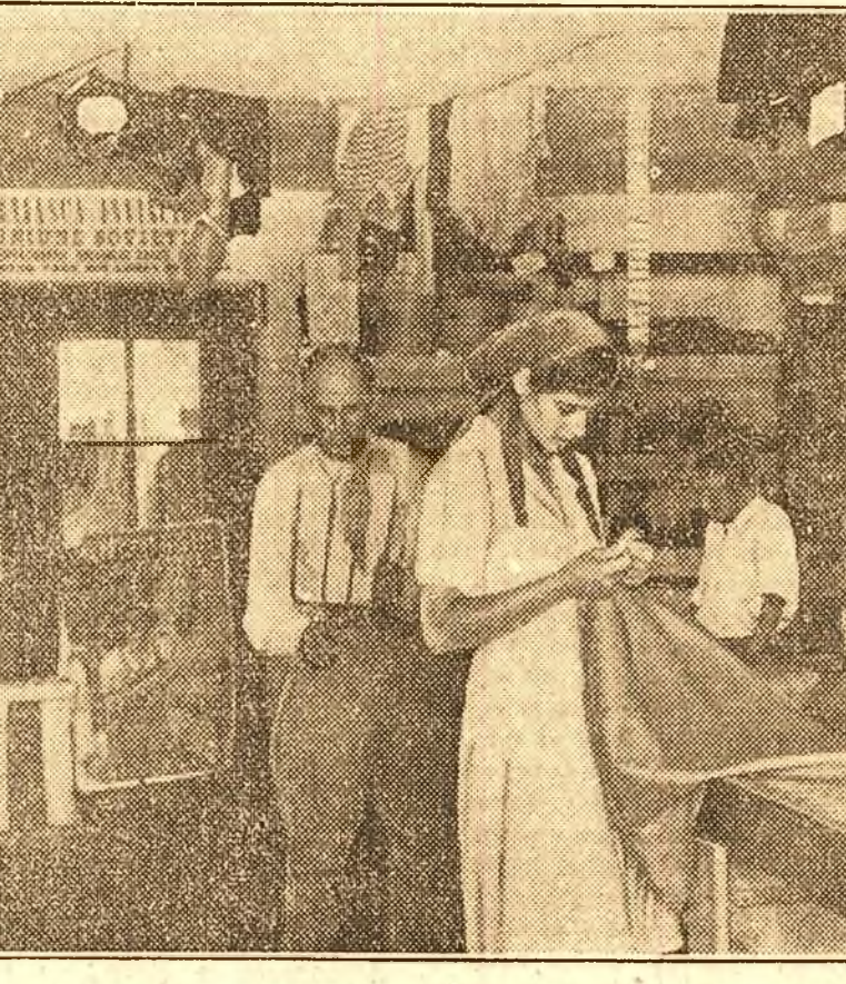
Desvoltându-se pe baza aplicării experienței cooperativelor sovietice, mișcarea cooperativă din țara noastră, sub îndrumarea Partidului, obține succese tot mai mari în ce privește schimbul de mărfuri dintre oraș și sat. Numărul cooperativelor din țara noastră a crescut dela 2624 cât aveam în 1945, la 5112, iar al cooperativelor dela 989.365 la 4.958.224. Oamenii muncii dela oraș și sate găsesc la cooperative din ce în ce mai multe mărfuri industriale și produse agricole. Numai în anul acesta s'au vândut prin cooperative mărfuri în valoare de peste 30 miliarde lei.

Cooperarea din țara noastră slujește interesele poporului muncitor