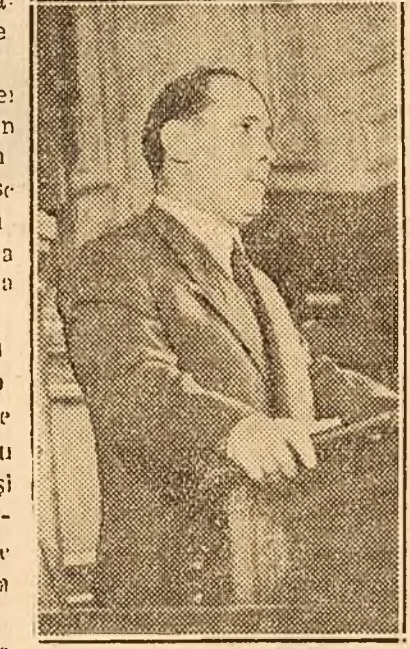
Raionarea exprimă conținutul de clasă al statului de democrație populară și al or-

In numărul de azi: - Schimbul de onoare în cinstea Congresului. - Delegați ai păcii. - Harta împărțirii administrative a teritoriului Republicii Populare Române.