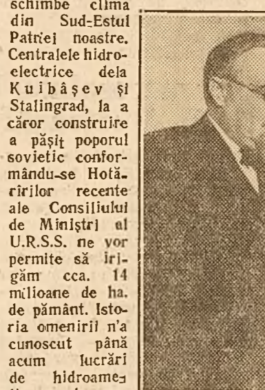
Academicianul A. I. Oparin