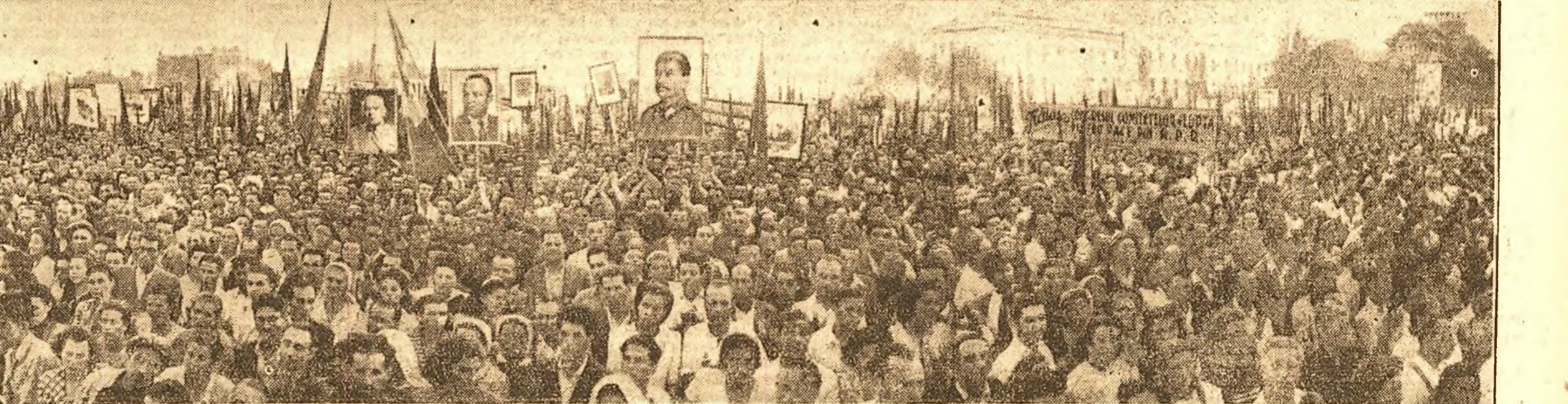
Un aspect al Pieței Victoriei în timpul marelui meeting de ieri la care au luat parte peste 200.000 cetățeni ai Capitalei.

— să ceară retragerea imediată a tuturor trupelor aflate pe teritorii străine.