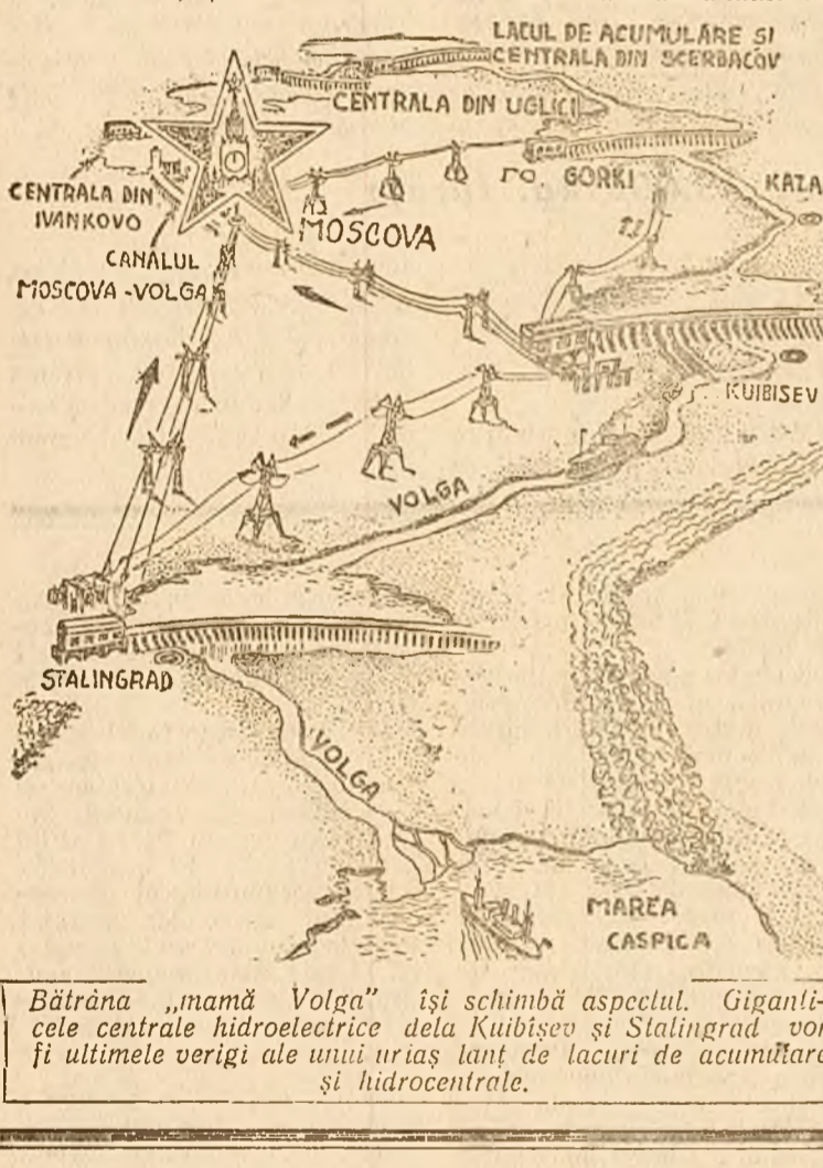
Bătrâna „mamă Volga” își schimbă aspectul. Giganticele centrale hidroelectrice dela Kuibisev și Stalingrad vor fi ultimele verigi ale unui uragun de lacuri de acumulare și hidrocentrale.