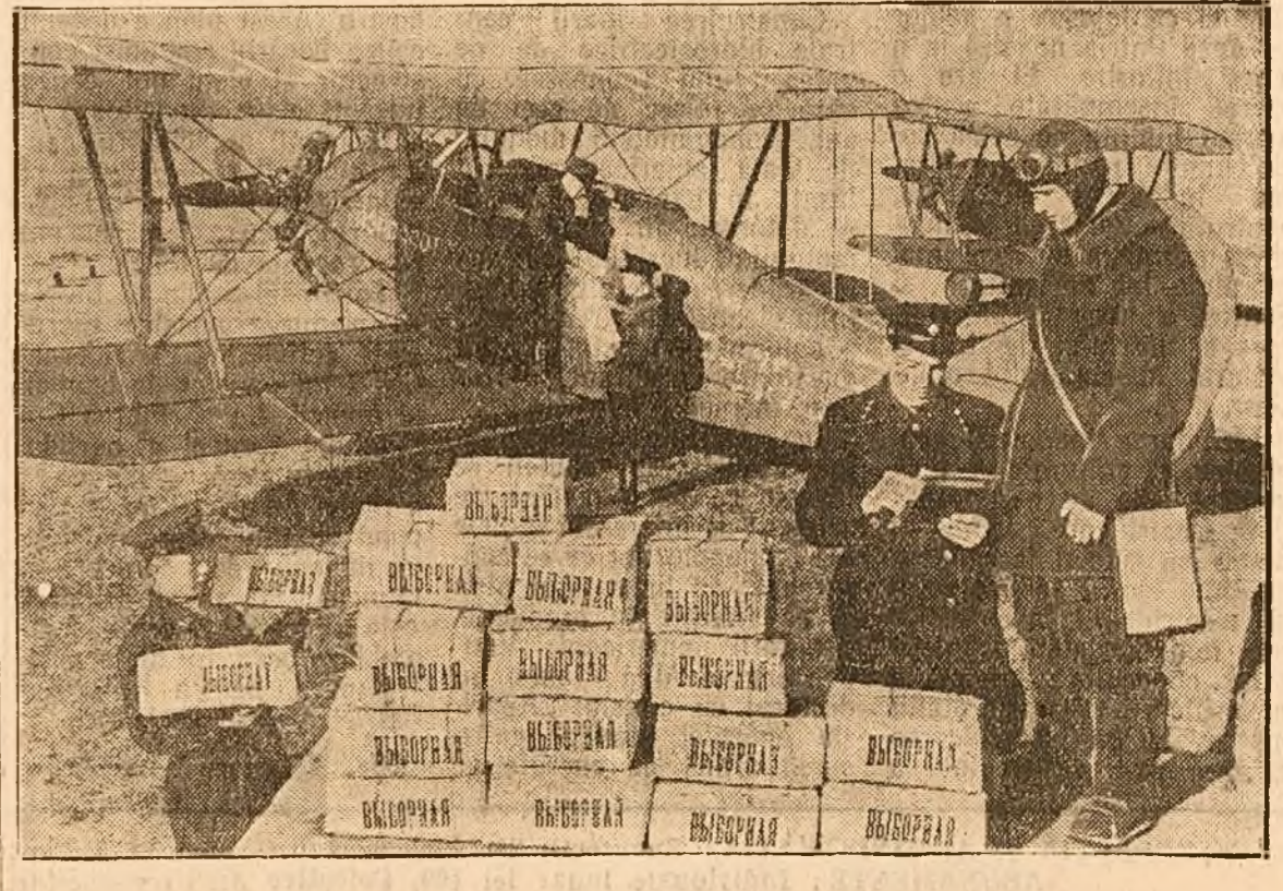
Avioanele duc cărți și broșuri până la Casele Alegătorului din cele mai îndepărtate puncte ale U.R.S.S.

Lenin a spus despre Soviete că reprezintă un tip nou, superior al democrației. Activitatea de zi cu zi a Sovietului din raionul Sovietic al Moscovei confirmă în totul aceste cuvinte.