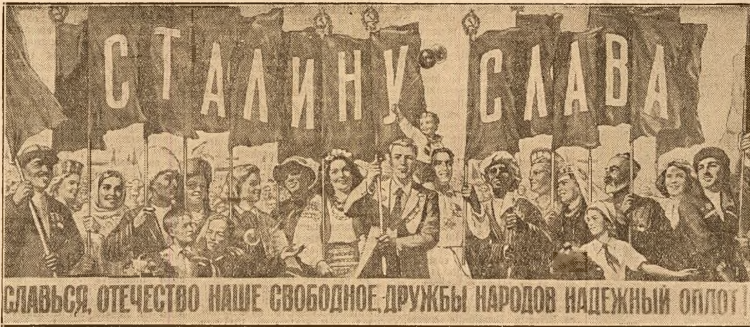
„Nalțăte'n glorie, Patrie liberă, stălp al înrății popoarelor ești!” (Afiș electoral de N. Ivanov)