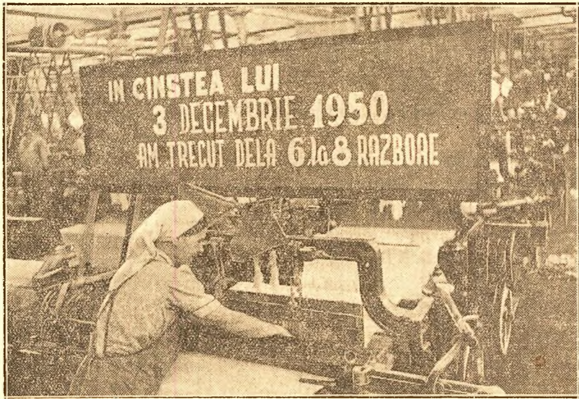
In cinstea alegerilor de deputați pentru Sfatul Popular, tovarăsa Zaharia Elena, dela fabrica de șturți „Donca Simo” din Capitală, a trecut să lucreze dela 6 la 8 războaie simple, dând astfel mai multă pânză de bună calitate. Iată-o pe tovarăsa la una din mașinile pe care le conduce.