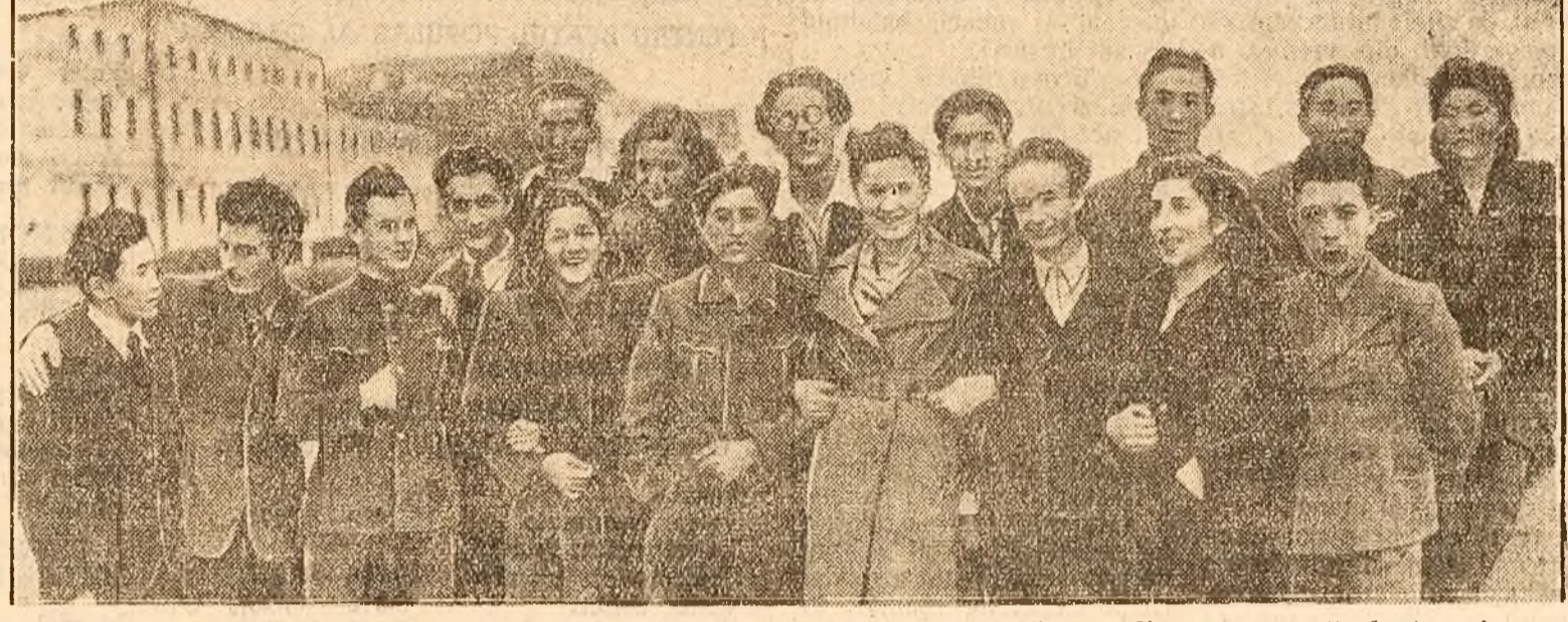
Cetățenii U.R.S.S. au dreptul la învățământ (Art. 121). Priorități pe acești tineri studenți la Universitatea din Leningrad, cu țele surzătoare, și veți pricepe cât de real este acest drept pentru oamenii sovietici...