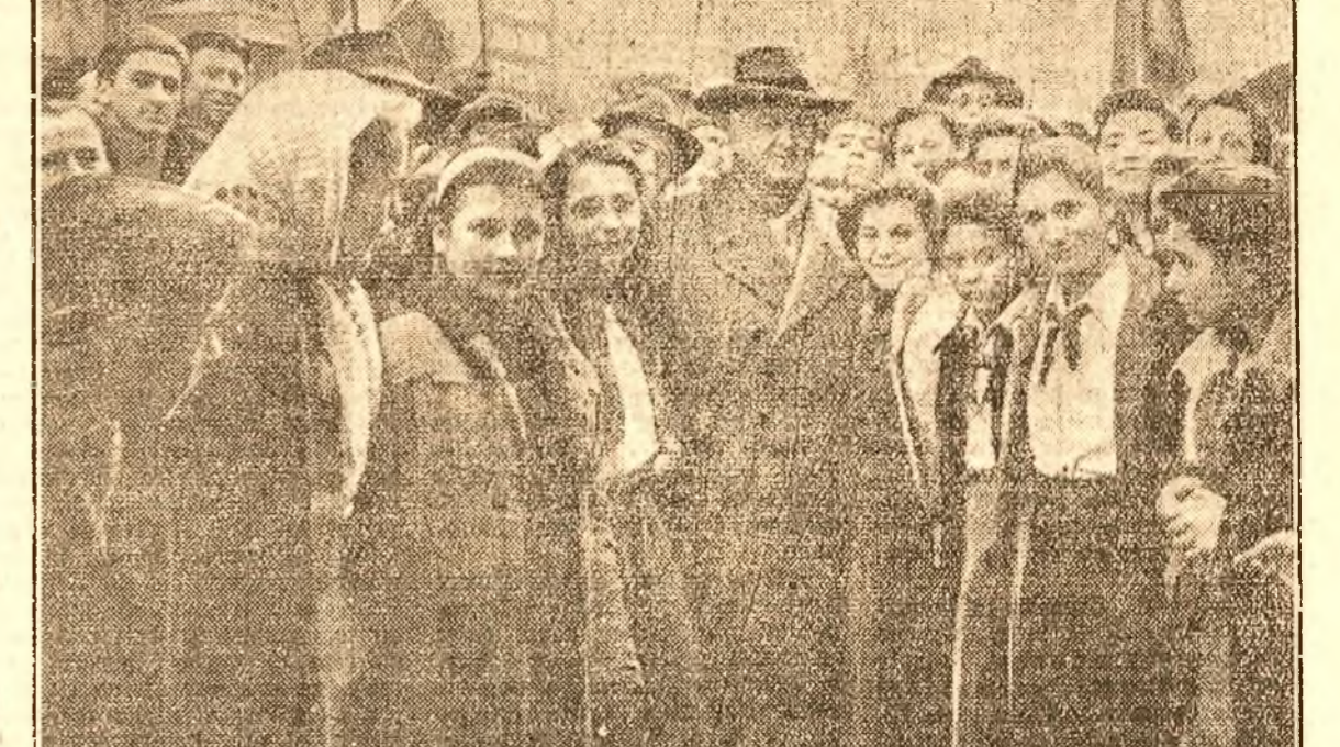
În Jașa secției de votare Nr. 15, din str. Pilar Moș, alegători și pioniere neînjurat cu dragoste pe marele nostru scriitor Mihail Sadoveanu, candidatul lor pentru Statul Popular regional.

La secția de votare nr. 32, au venit gospodinele de pe strada Alunis, unde s'a intr-