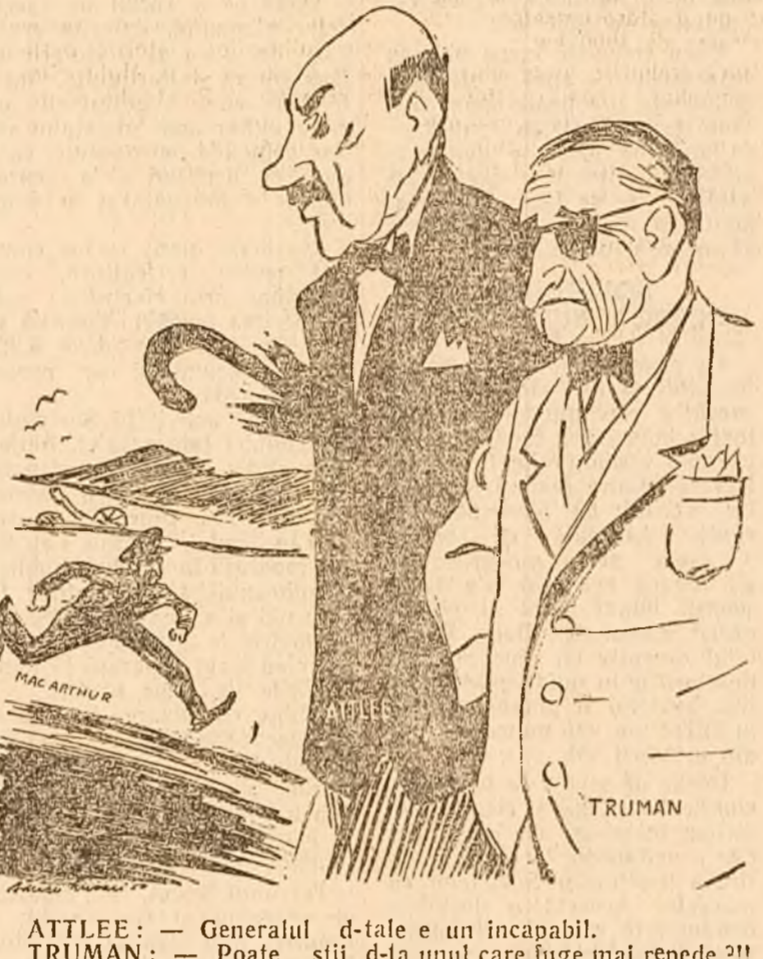
ATTLEE — Generalul d-tale e un incapabil. TRUMAN — Poate știi d-ta unul care luze mai repede!!!

Trimisul special al agenției „France Presse”, Philippe Daudy transmite următorul raport din orașul Seul: „Dacă ieri (6 Dec.) se vorbea de retragerea trupelor O. N. U. din Coreea, astăzi (7 Dec.) evacuarea totală a Coreei forțată obiectul tuturor conversațiilor de pe străzile din capitala Coreei, de pe culoarele sta-