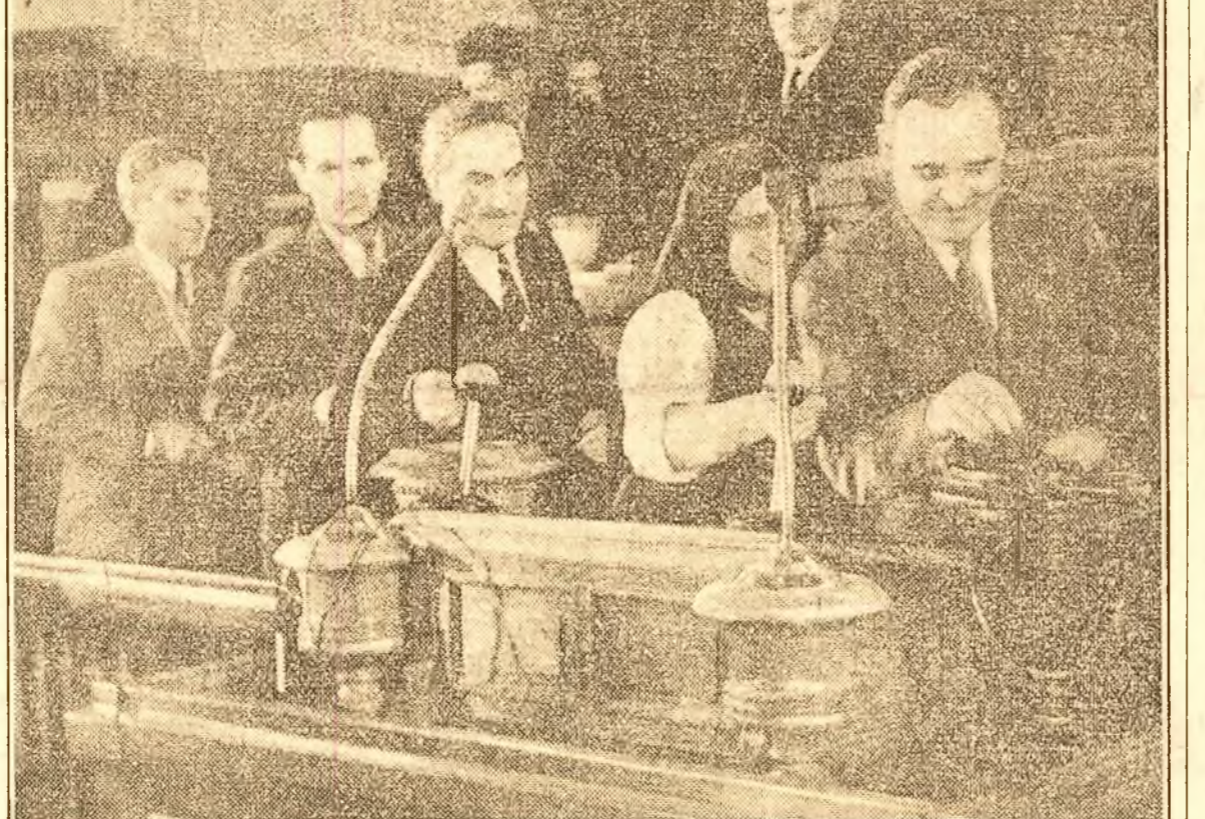
Votarea legii Planului Cincinal. Votează tovarășul Gheorghe Gheorghiu-Dej