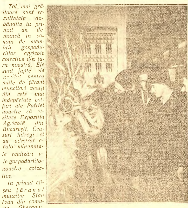
Tot mai grăitoare sunt rezultatele dobândite în primul an de muncă în comun de membrii gospodăriilor agricole colective din țara noastră...