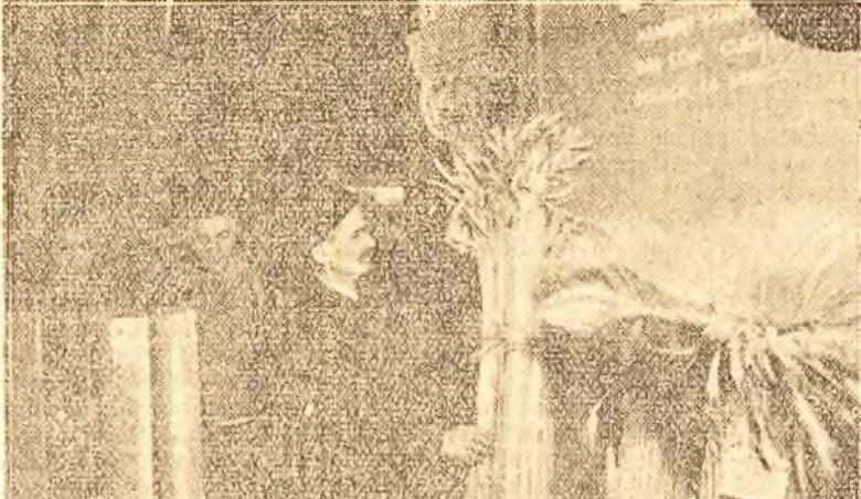
Fapte nu vorbe: recoltele gospodăriilor agricole colective