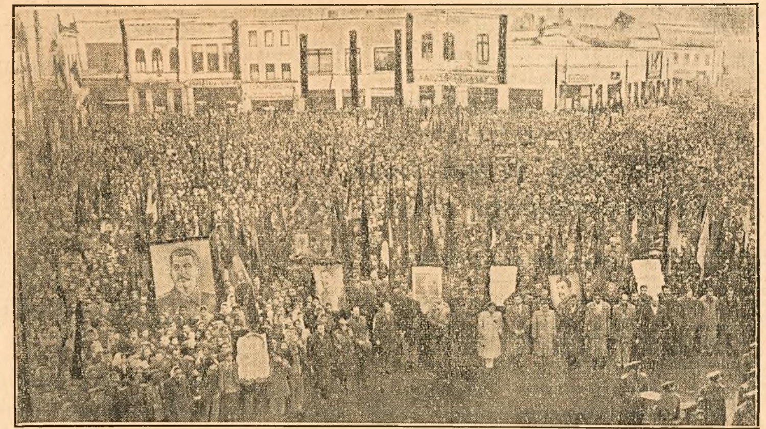
Mii și mii de oameni ai muncii de pe întreg cuprinsul patriei noastre și-au luat rămas bun cu adâncă mâhnire dela marele conducător și învățător al omenirii muncitoare, cel mai înțelept și mai iubit prieten al poporului nostru, marele Stalin. Biruindu-și durerea adâncă el și-au exprimat hotărârea de a merge înainte pe calea luminată de genialele învățăături staliniste, de a strânge și mai mult rânduiri în jurul partidului, de a-și ascuți vigilența împotriva uneltirilor dușmanilor omenirii și ai păcii, imperialiștilor americani și englezi. In clișeu: Oamenii muncii din orașul Ploiești păstrează minute de reculegere în memoria tovarășului Stalin.

Anii dela eliberarea Coreei de către Armata Sovietică până în ziua atacului armat al clicii înșanmaniste, care a dezlănțuit din ordinul imperialiștilor americani sângerosul război, au fost anii cel mai fericiți din existența Coreei, au fost cu adevărat veacul ei de aur. În acești 5 ani, poporul eliberat a primit mai multe bunuri mate-