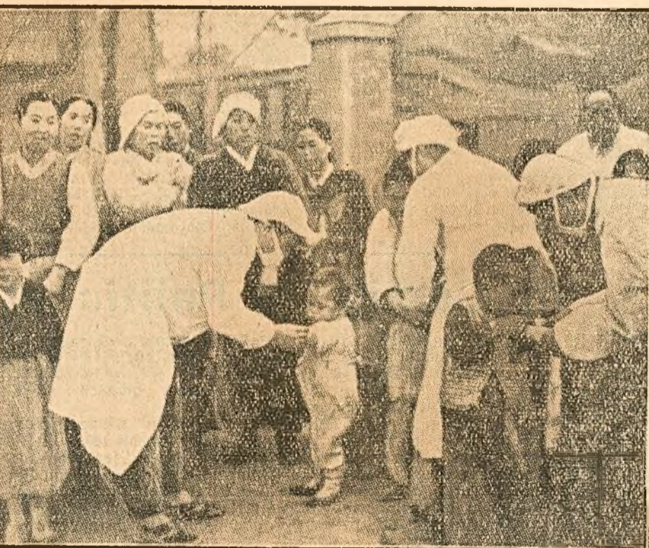
Infuriați de înfrângerile suferite pe câmpul de luptă, agresorii americani au dezlănțuit încă dela sfârșitul anului 1951 criminalul război bacteriologic pe teritoriul Coreei și al Chinei de Nord-Est. Primul clișeu reprezintă tipul obișnuit de bombă bacteriologică folosit de către aviația americană în Coreea și China. Ca un singur om s'a ridicat însă întregul popor al Coreei-martire pentru a dejuca și aceste monstruoase acte — nemaiomenit de barbare — ale canibalilor americani. Al doilea clișeu reprezintă un grup de femei strângând cu grijă insecte