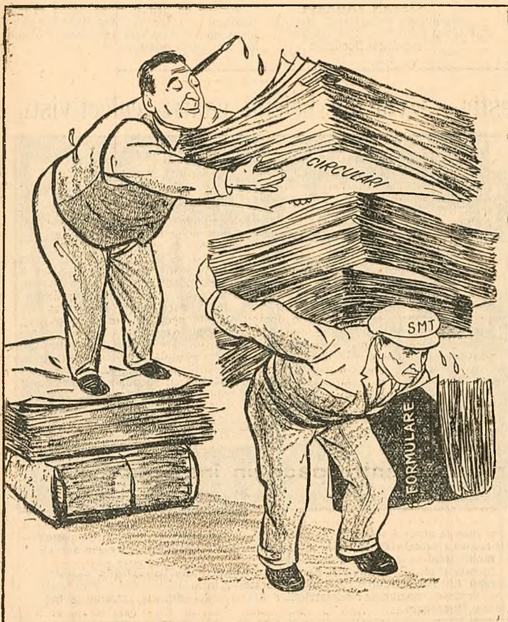
— Ei, cu așa ajutor, o să meargă strună însămănările...

Directia generală S.M.T. a trimis stațiunilor, în Ianuarie 1953, instrucțiunile și anexe totalizând... 350 pagini.