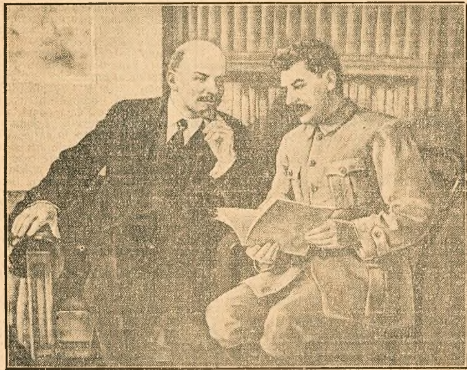
V. I. LENIN și I. V. STALIN

Partidul Comunist Francez reputează noi succese în lupta sa. În ultimele alegeri parlamentare, care au avut loc în 1951, partidul comunist a obținut peste 5.000.000 de voturi, situându-se pe primul loc între toate partidele din țară.