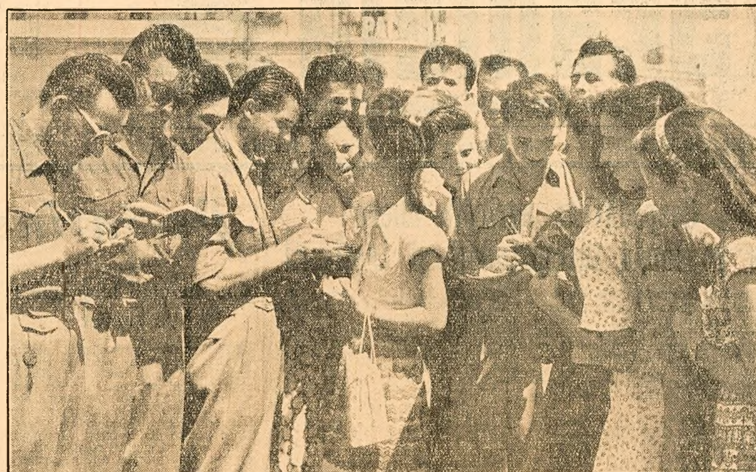
— Nu, nu vom uita aceste zile! Tinerii din R.P.R. stau de vorbă cu oaspeții, schimbă păreri, impresii. „Pentru amintire despre tot ce-am discutat și văsat în aceste zile, iată semnătura mea!” își spun unii altora, noii prieteni.

Acesta e subiectul emoționantului film „Ana proetara”. Pictorul rulează în cadrul Festivalului filmul — producție a studiourilor cehoslovace — e primit cu multă căldură de public.