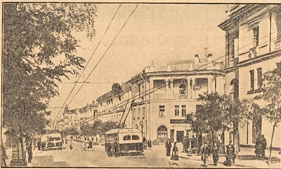
În toate colțurile Ununii Sovietice, la sate și la orașe, se desfășoară pe scară largă construcțiile de locuințe. Numai după război în orașele și centrele muncitorești ale țării au fost construite și refăcute noi case de locuit pe o suprafață de peste 155.000.000 m. p. În clișeu: Noi case de locuit construite pe strada „Bolșoia Morscaia” din Sevastopol.

De curând s'a deschis în Parcul central de cultură și odihnă din orașul Chișinău primul cinematograful la lumina zilei din R.S.S. Moldovenească. Acest nou cinematograful este înzestrat cu un ecran special care permite vizionarea filmelor și atunci când e soare puternic sau la lumina electrică. La acest ecran, realizat de un grup de ingineri și tehnicieni din Direcția centrală a cinematografului din Ministerul Culturii R.S.S. Moldovenești, pot fi redată îndeosebi filme tehnice-