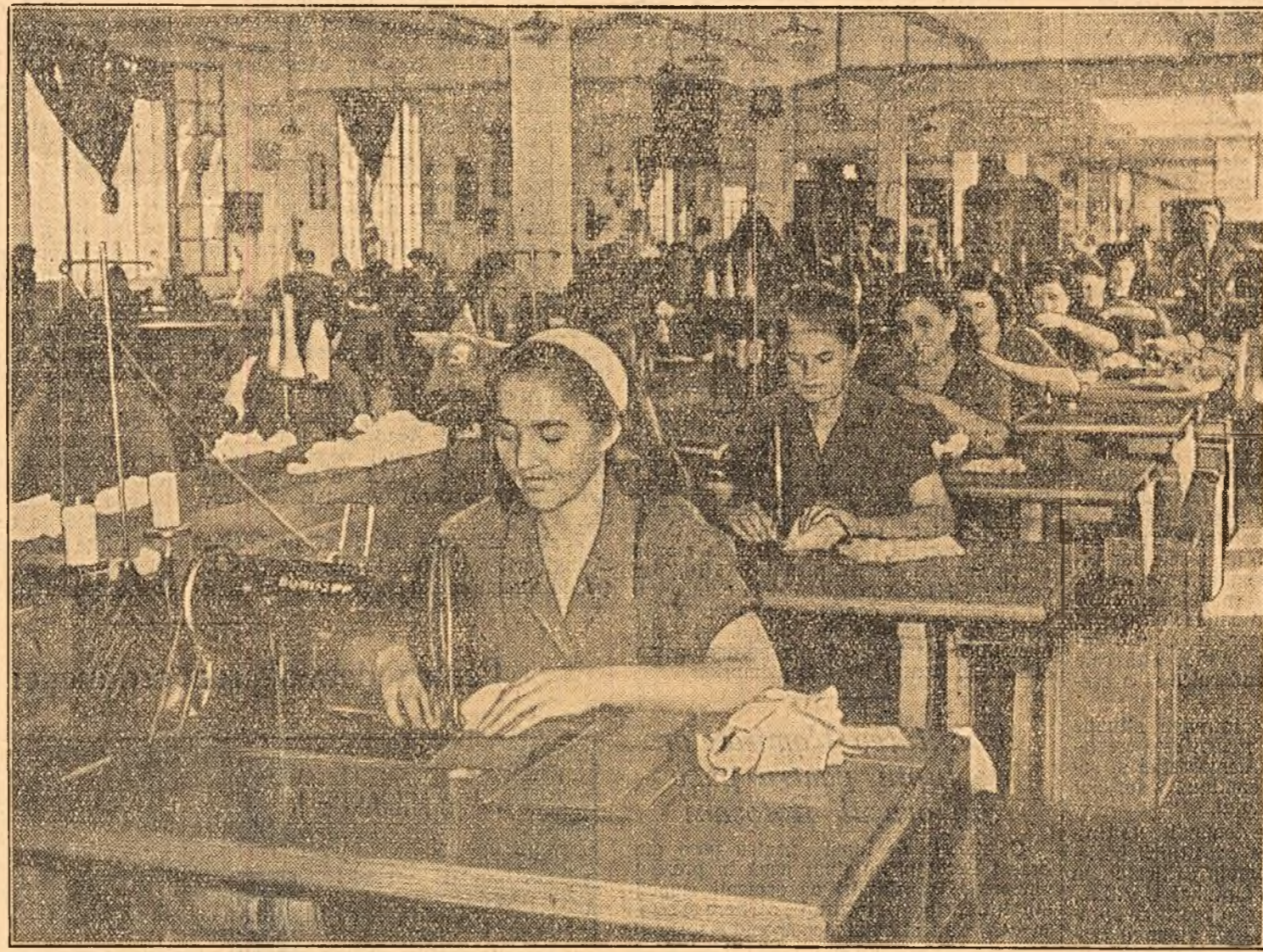
Îmbunătățirea calității produselor este una din preocupările de frunte ale muncitorilor fabricii „Tricotajul Roșu”. În clișeu: membrele brigăzii stahanoviste „21 Decembrie”, brigadă fruntașă în lupta pentru o producție sporită și de bună calitate.