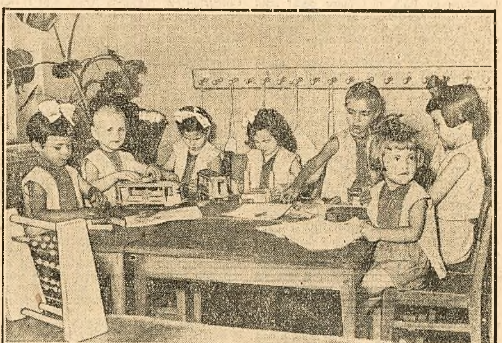
Constituția prevede că statul ocrotește căsătoria și familia și apără interesele mamei și copilului. În țara noastră crește an de an numărul caselor de naștere, al maternităților, al creșelor și căminelor de zi pentru copii. În câșeu: La câminul fabricii de țigărețe din București.