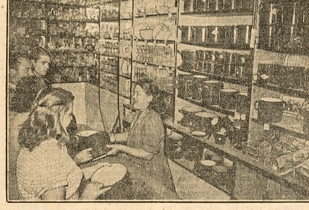
In urma hotărârilor plenarei C.C. al P.M.R. din 19—20 August, cu privire la sarcinile partidului în domeniul dezvoltării economiei naționale și ridicării continue a nivelului de trai, material și cultural al oamenilor muncii, întreprinderile industriale ușoare și alimentare produc tot mai multe bunuri de larg consum. În clișeu: Într'un magazin din Ferentari articole de menaj și uz casnic.