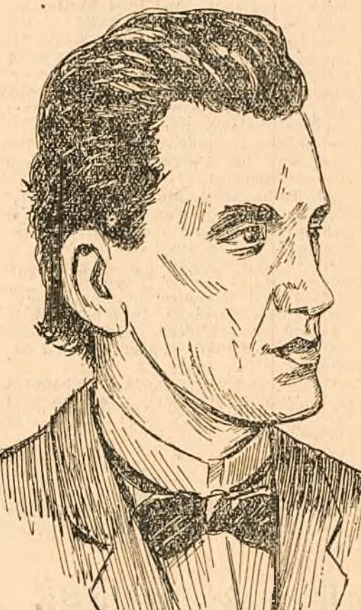
Ciprian Porumbescu era conștient că, prin creația sa, slujește poporului, înfăptuindu-l „Românii înfloritoare” către care năzuia mereu gândirea sa înaripată de artist patriot.

poporului („Păstori și plugari", „Sergentul", „Penes Curcanul", „Visul Păcurului"). Ciprian Porumbescu a știut să dea creațiilor sale patosul luptei poporului pentru o viață mai bună, și să mănănuască cu putere și biciul științurilor al satirilor împotriva dușmanilor poporului. Aceasta este o tradiție de preț a muzicii noastre, o pildă pentru compozitorii de astăzi.