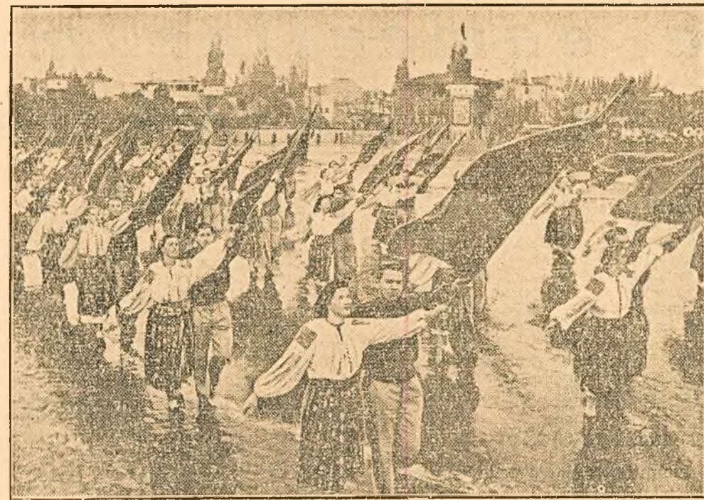
Doi câte doi, cu steaguri larg desfășurate în vânt, tineri sportivi îmbrăcați în salopete albastre și tinere îmbrăcate în costume naționale defilează prin fața tribunelor, simbolizând alianța de nezdruclinat dintre clasa muncitoare și țărănimea muncitoare, temelia regimului de democrație populară și izvorul principal al țării lui.

Minute în șir au trecut prin fața tribunelor sportivi și sportive din asociațiile „Locomotivă”, „Flacăra Roșie”, „Școala”. Sub faldurile drapelurilor reprezentând asociația „Progresul”, trec în primele rânduri tinerii sportivi din echipa de volei campionă a țării noastre. Urmează apoi, puternic aplaudați, sportivii asociațiilor „Flacăra”, „Șantierul”, „Construcțiunea”, „Rezervele de Muncă”, „Știința”, „Spartac”, „Minerul”, „Metalul” — mii și mii de tineri vănoși și oțelii, bronzaiți de soarele verii, plini de forță și optimism, de bucurie de viață. Ei înfruntă cu zămbetul pe buze frigul și răpăitul ploii, ma-