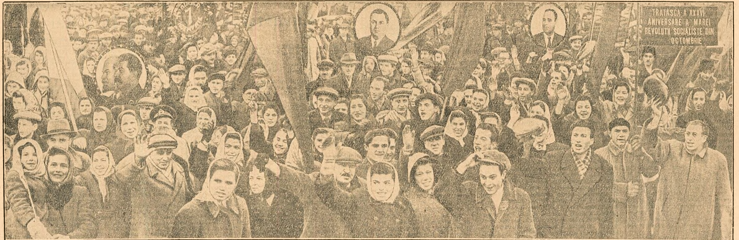
Trecând prin fața tribunelor din piața I. V. Stalin, oamenii muncii din Capitală manifestează cu entuziasm pentru Partidul Muncitoresc Român — conducătorul încercat al poporului nostru pe drumul apărării păcii, al construirii socialismului și al fărâșirii bunăstării — pentru prietenia de nezdruclinat cu marea noastră eliberatoare, Ununea Sovietică.

Demonstrația oamenilor muncii din Orașul Stalin a prilejuit o puternică măritorie a hotărârii acestora de a-și strânge și mai mult rândurile în jurul partidului și guvernului nostru, a căror lege supremă este slujirea devotată a poporului, și de a-și spori eforturile pentru înfăptuirea sarcinilor trasate de partid în vederea creării unei abundențe de produse de larg consum.