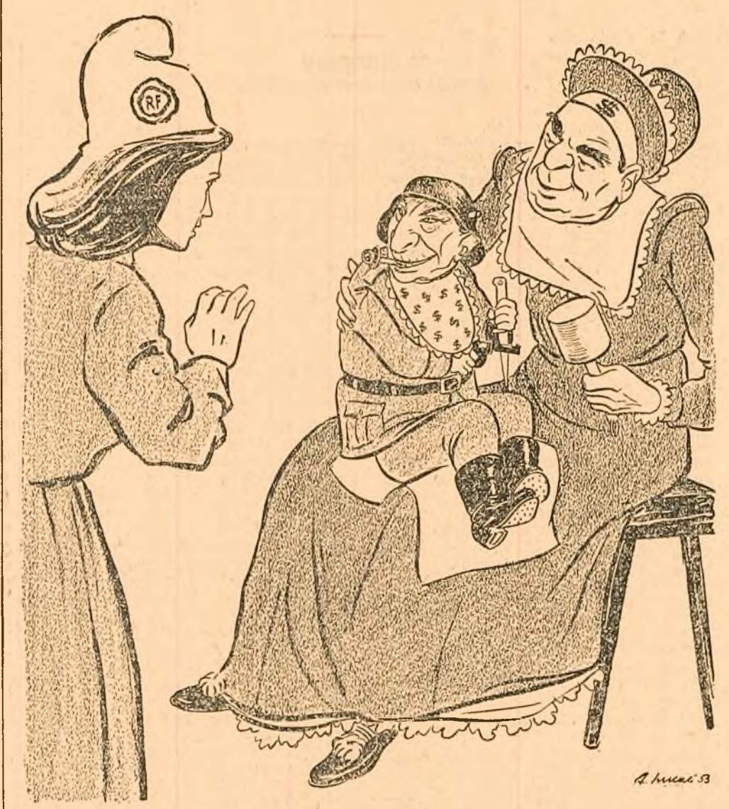
Trustman-ul: Zâmbește lui tantii să vadă că ești de defensiv!

Ma Impresionat deosebit de mult — ne declară pictorul James Boswell — violența, figurile deschise ale oamenilor de pe străzile Bucureștilor. Această impresie este complet diferită de înfățișarea de primă a oamenilor de pe străzile orașelor din Apus. Listează întregi de oferte de servicii, care apar în unele zăbre, mi-au confirmat faptul că șomajul a fost lichidat și că în prezent crește tot mai mult nevoia de brațe de muncă și de cadre calificate. Aceasta face ca oamenii din România să aibă siguranța zilei de mâine. Și ce mare lucru este aceasta, în raport cu situația din Anglia și din alte țări din Apus, unde spectrul șomajului amenință pe fiecare muncitor!