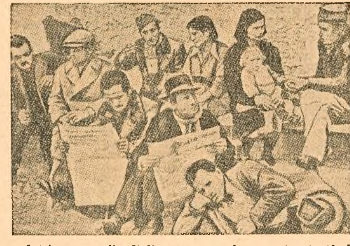
Intr'un oraș din Italia, un grup de șomeri așteptând în stradă să capete de lucru.

O grevă a docherilor în portul New York. In cliseu: un pichet de grevă patronează pe chel pentru a preîntâmpina încercările patronilor și ale bossilor sindicatului de a aduce spărgători de grevă.