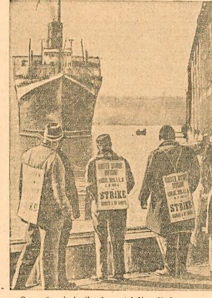
O grevă a docherilor în portul New York. In cliseu: un pichet de grevă patronează pe chel pentru a preîntâmpina încercările patronilor și ale bossilor sindicatului de a aduce spărgători de grevă.

după cum se vede și din aceste fotografii, în țările capitalistice viața devine din ce în ce mai grea pentru cei ce muncesc.