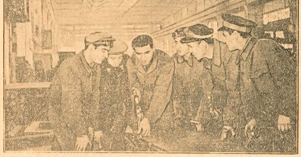
Faptul că Prezidiul Marii Adunări Naționale a atribuit uzinelor „Vulcan” numele tovarășului Mao Tze-dun a stârnit un puternic entuziasm în rândurile muncitorilor și tehnicienilor din această importantă uzină. Întreg colectivul întreprinderii s'a angajat să muncască mai bine, să dobândească noi realizări în producție.