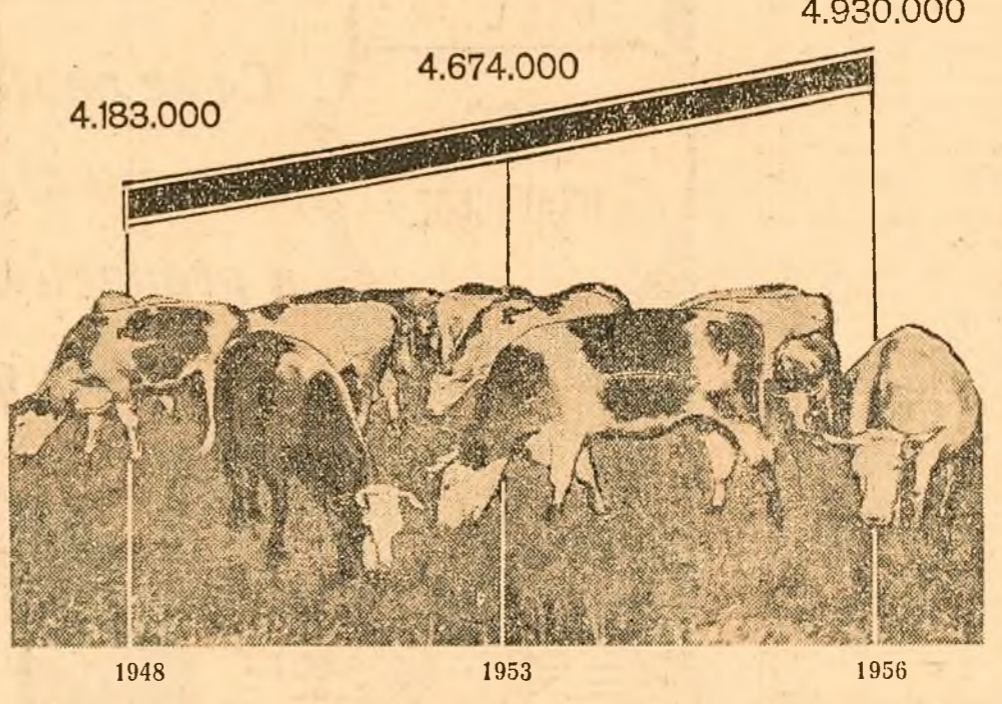
Înfăptuirea prevederilor legii privitoare la măsurile pentru dezvoltarea creșterii animalelor va duce la o astfel de creștere a numărului de animale și a productivității lor, încât în următorii 2-3 ani să se asigure o simțitoare îmbunătățire a aprovizionării populației muncitorești dela orașe și sate cu produse alimentare și a industriei ușoare cu materii prime. Grădnic de mai sus reprezintă creșterea numărului de bovine. În anul 1954-56 numărul bovinelor va crește cu peste 250.000 capete.