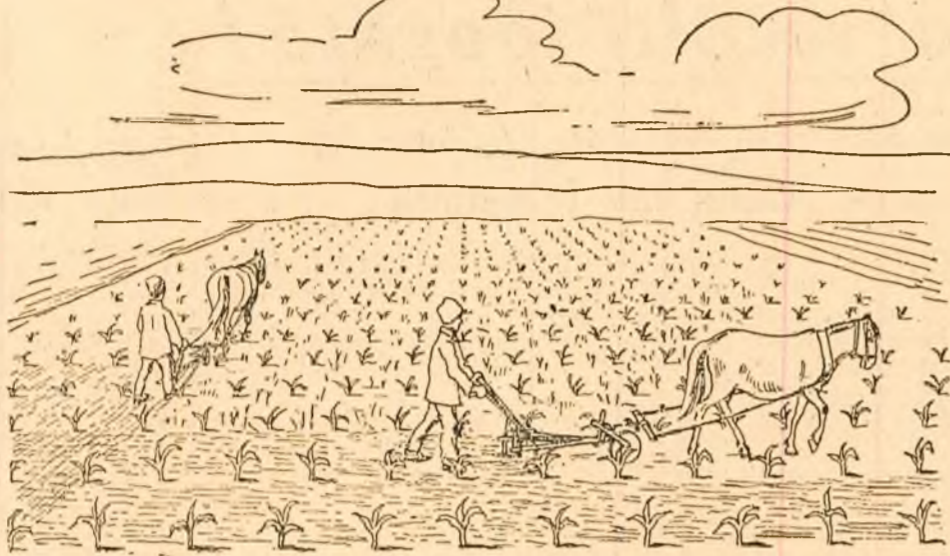
Prășitul în lung și în lat cu prășitoarea trasă de cal

La de ce este mai bine să se facă prășitul cu mijloace mecanizate. În mod obișnuit, prășitul mecanic se face pe suprafețe mai mari (în gospodăriile agricole de stat, gospodăriile colective, întovărășiri agricole) cu cultivatoarele de tracțiune mecanică iar pe suprafețe mai mici (în gospodării țărănești individuale) cu prășitoarea mecanică trasă de un cal.