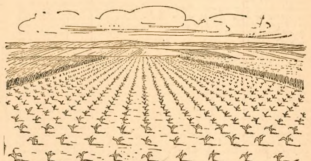
Un lan de porumb semănat în cuiburi așezate în pătrat