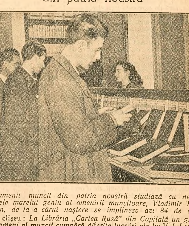
Oamenii muncii din patria noastră studiază cu nesof operele marelui geniu al omenirii muncitoare, Vladimir Ilici Lenin, de la cărui naștere se împlinesc azi 84 de ani. În cliseu: „La Bibliotecă „Carlea Rusă” din Capitală un grup de oameni ai muncii cumpără diferite lucrări ale lui V. I. Lenin“.