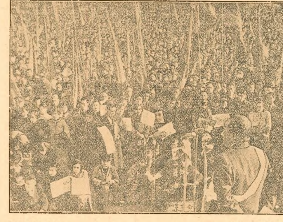
In întreaga Japonie se desfasoară cu intensitate crescîndă lupta activă a oamenilor muncii împotriva politicii de pregătiri militare și de adincire a mizeriei și suferințelor populației - politica dusă de cercurile conducătoare la ordinele ocupanților americani. Prin numeroase și puternice demonstrații și greve, oamenii muncii cer cu hotărîre guvernului să ia măsuri grabnice in vederea sporirii salariilor la nivelul șompetei, pentru respingerea „ajutorului” american, care subminează economia Japoniei, împotriva remilitarizării Japoniei.

Luînd cuvîntul la conferință, deputata laburista Jennie Cannock a spus între altele: „Decă există unii americani care sint înclinați să arunce bombe cu hidrogen asupra Chinei sau Indochinei, atunci trebuie să li se spună limpede că ei nu pot continua această politică și spera in același timp să se bucure de prietenia și colaburarea poporului britanic...”