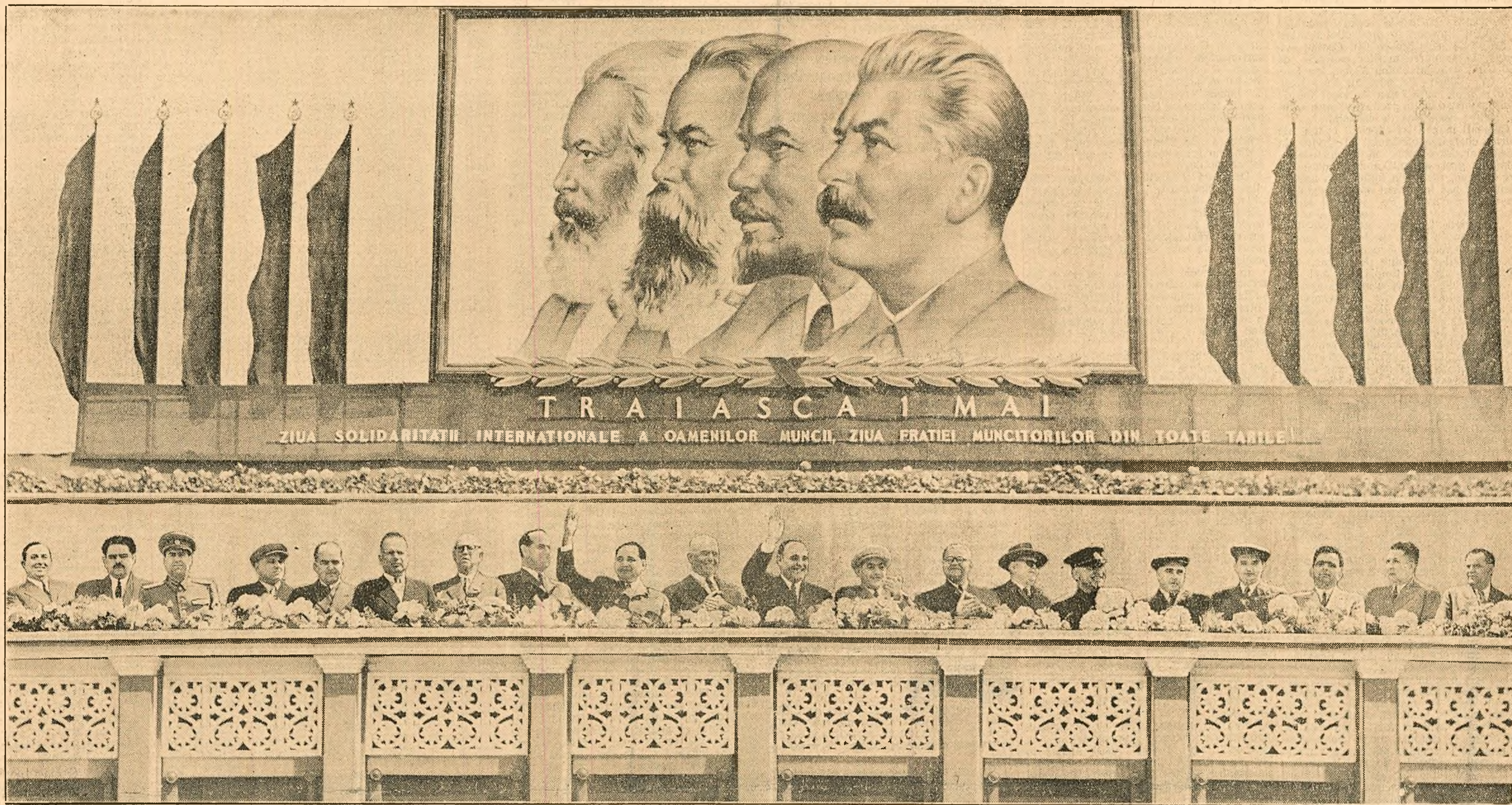
Un aspect al tribunei centrale din Piața „I. V. Stalin“, în timpul demonstrației oamenilor muncii.