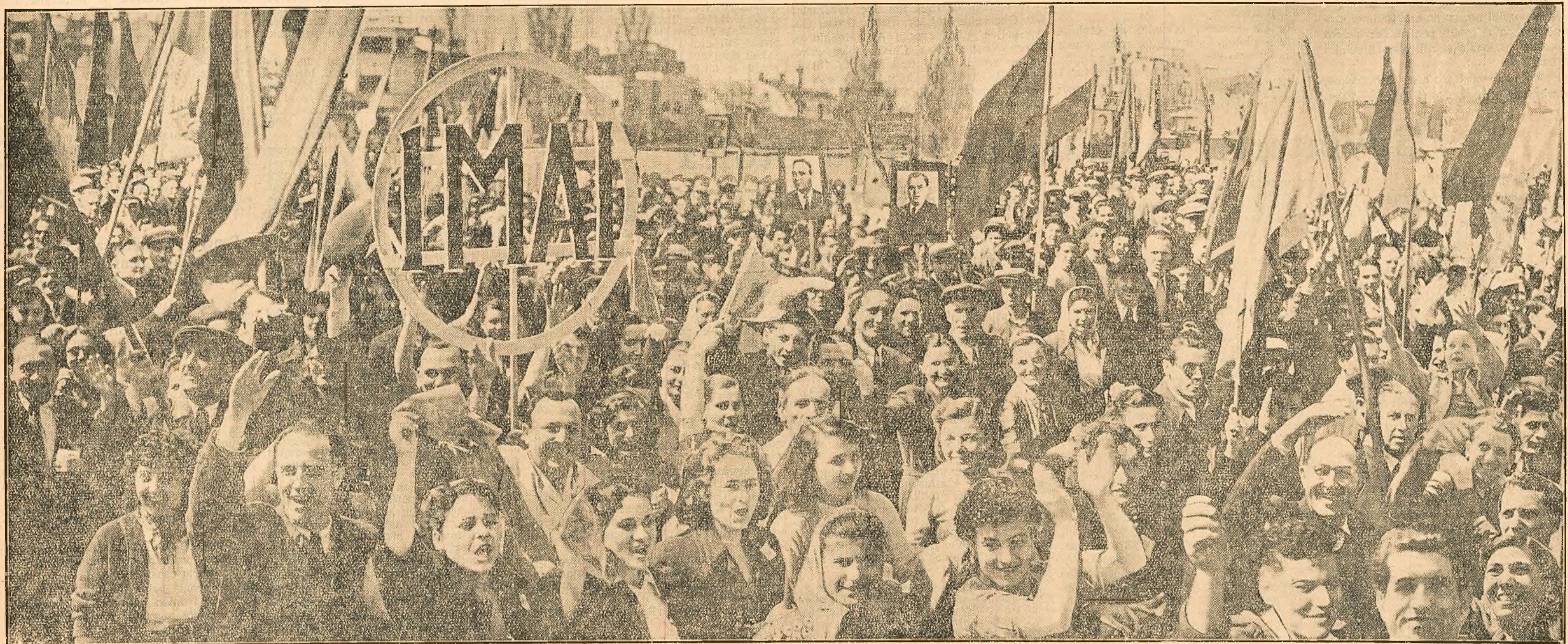
Ore în șir au defilat coloanele oamenilor muncii prin Piața Stalin, exprimîndu-și hotărîrea nezdruccinată de a-și inchina toate forțele apărării păcii și ridicării nivelului de trai al poporului.

Ca și în ceilalți ani, ziua de 1 Mai a fost sărbătorită cu nespuse bucurii de oameni muncii din Capitală.