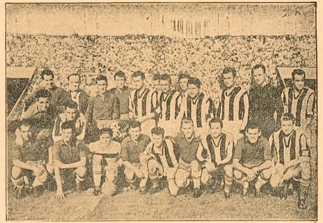
Echipele de fotbal „Dozza”-Budapesta şi „Dinamo”-Bucureşti, care s-au întrecut duminică pe stadionul „23 August”

Duminică după-amiază se aflau în tribunele stadionului „23 August” din Capitală aproape 100.000 de spectatori care veniseră să asiste la întîlnirea internaţională prietenească dintre echipele de fotbal „Dozza-Budapesta” şi „Dinamo-Bucureşti”.