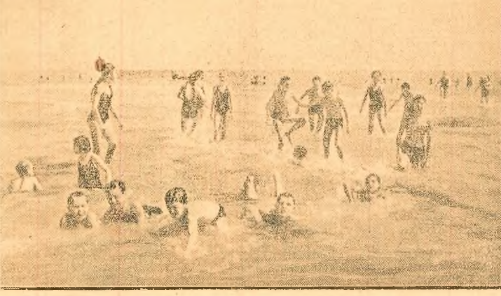
Pionierii din tabăra de la Mamaia zburdă cu voioșie în apa mării.

săltăret al muzicii transmise prin megafone. În sala de mese, totul e frumos rînduit: farfuriile pline cu cuburi de unt și de marmeladă, felurile de pine proaspătă. Bucătăreasa pregătește cafeaua cu lapte. Nu trece mult și musafirii sosesc. Sala strălucete de curățenie. Copiii se așează în jurul meselor acoperite cu fețe albastre. Pionierii de jurnă se întrec care să ser-