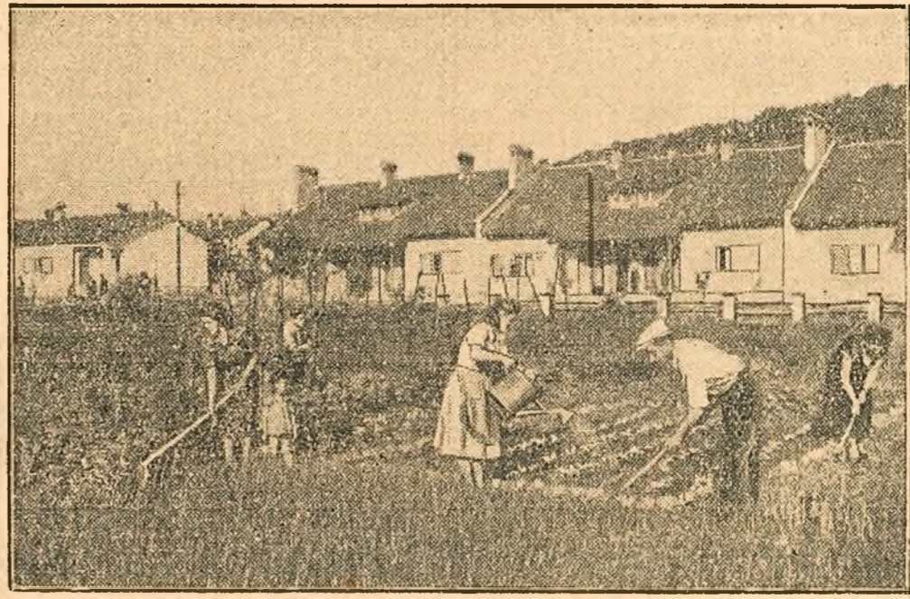
Muncitorii de la I.M.S.-Hunedoara cu familiile lor îngrijesc în timpul liber culturile de legume și zarzavaturile de pe loturile individuale