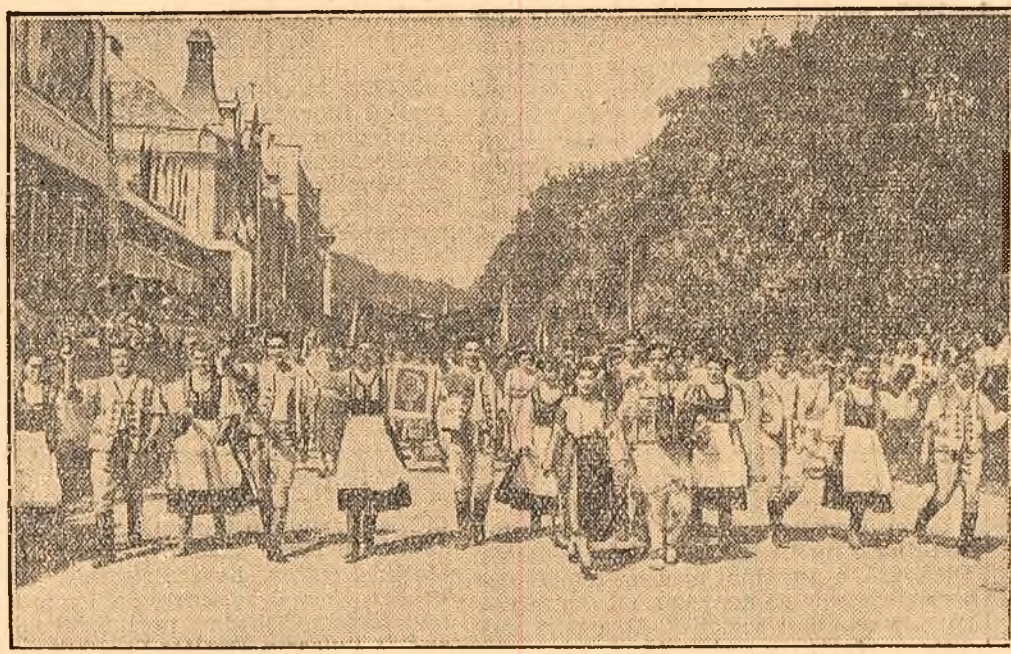
Plini de voiești, în costumele lor pitorești, au trecut prin fața tribunei din Orașul Stalin membri ai echipelor de dansuri.