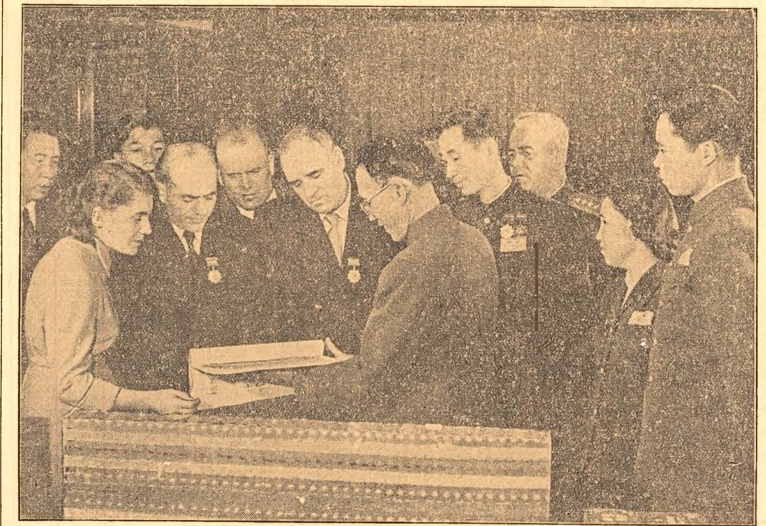
Conducătorii Ansamblului de cîntece și dansuri al Armatei Populare Chineze de Eliberare la Consiliul de Miniștri al R.P.R.