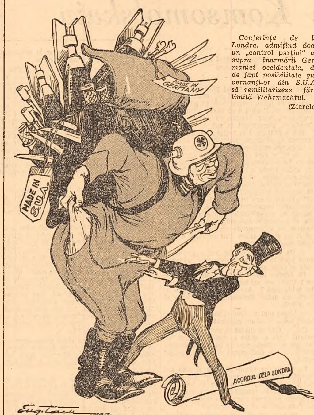
ADENAUER: — Controlați, vă rog... parțial!... Desen de EUG. TARU