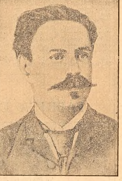
omului în armata burghezo-moșierescă, („Sorțarii”), soarta femeii muncitoare în societatea capitalistă („În tina prostituției”, „Cusătoreasa”); Neculuță a combătut șovinismul („La un vandalism antisemit”, „Țigani”), pesimismul fătarnic al tineretului corupt. Nenumărate aspecte din viața se oglindesc în versurile poetului, ilustrînd aciel sentiment de răspundere pentru întreaga viață socială, care se degajă din opera adevăraților creatori.

În „Cor de robi” apare în germen ideea necesității luptei unite a muncitorimii și a țăranimii exploatare, idee exprimată cu o ardore deosebită: „Dar într-o zi, din văi, din munși / Din sate și orșe, / Voinici, ferai, bărbați covorși / Se vor scula și țari, și crunți, / Vor pune-n praf voastre frunși, / Jivinelor trușare!”