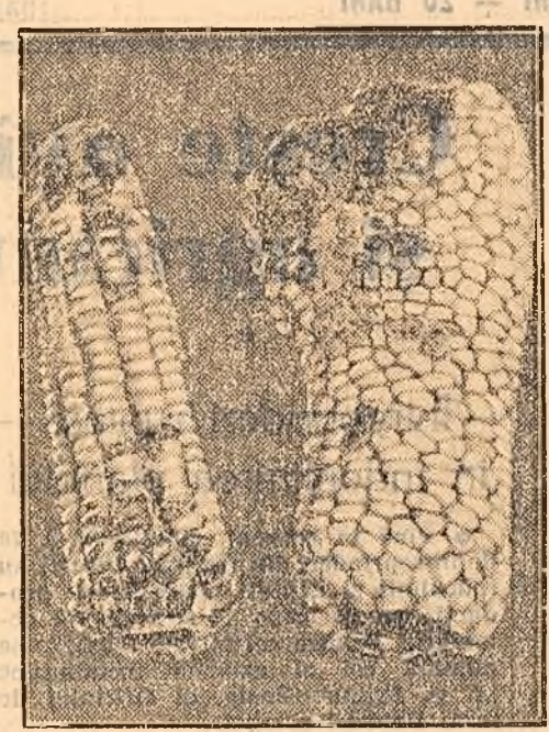
În clișeu: o mostră din porumbul depozitat în arnoia de la baza de recepție Găești.

În marea majoritate a regiunilor și raioanelor, organele de recepționare ale C.S.C.P.A. acordă o deosebită grijă păstrării în condiții cit mai bune a produselor. În alte locuri însă, această problemă deosebit de importantă este neglijată. Din cauza lipsei de răspundere cu care a fost