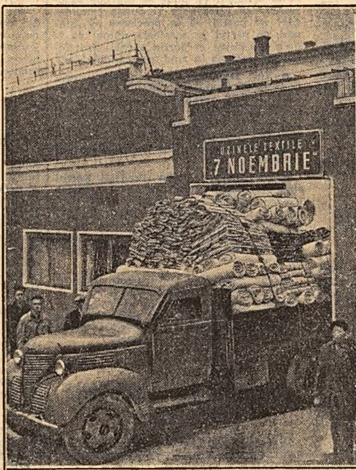
Zilnic, de la uzinele textile „7 Noiembrie” din Capitală iau drumul spre bazele de desfacere ale Ministerului Industriei Ușoare sau spre diferite țesături din țară camioane încărcate cu pînzării și cu fire. Colectivul fabricii a dat peste plan, în întrecerea în cinstea zilei de 7 Noiembrie, 11.470 kg. fire și 20.035 m.p. țesături. În cișeu: Autocamionul încărcat cu cei 20.035 m.p. țesături realizate peste plan în cinstea zilei de 7 Noiembrie porneste din fabrică spre baza de desfacere.