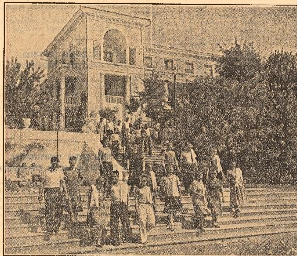
Întâlnirea frumoașă a clădirii a sanatoriului sindicatului muncitorilor din industria carboniferă...