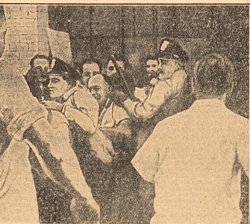
Cliseul de mai sus, apărut în revista americană "Newsweek", prezintă un aspect al grevei de la uzinele de aparat electric "Square D" din Detroit...