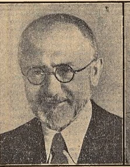
Acad. E. I. NYÁRÁDY Premiul I-a fost acordat pentru contribuția dată ca redactor responsabil la editarea volumelor I și II din Flora R.P.R., pentru prelucrarea monografică a familiei Crucifere din vol. III din Flora R.P.R. și pentru întreaga sa activitate științifică în domeniul botanicii.