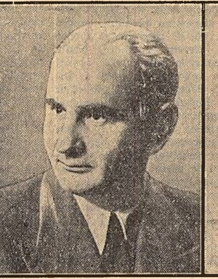
GEO BOGZA scriitor Premiul I-a fost acordat pentru volumele „Anii împotrivrării” și „Meridiane sovietice”.