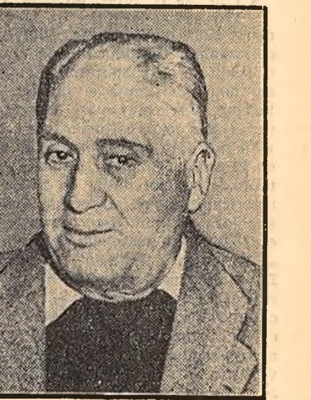
IOSIF ISER pictor Premiul I-a fost acordat pentru întreaga sa activitate artistică.